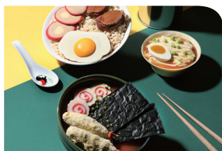
ROYAL DELIGHTS (R+) 1楼

以厨师发办为概念的中菜食府—狮房菜，以香港著名地标狮子山作灵感，糅合粤菜精粹及川菜元素，炮制出一系列注入狮子山下的味道及情怀的精致美馔。传统与新派元素细腻交融，配合细心周到的服务，为您提供崭新的感官及餐饮体验。